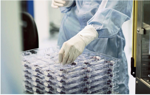
Les pièces et dispositifs médicaux réalisés par Groupe JBT sont fabriqués en salle blanche ISO 7.